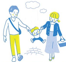
お子さまとの出かけの際に