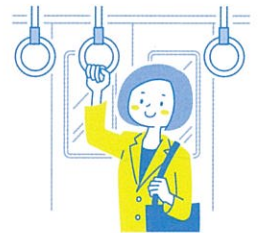
オフィスや通勤時に